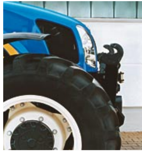
Absolut traktornaher Anbau, Unterlenker hochklappbar, serienmäßig mit Walterscheid-Schnellkuppler.